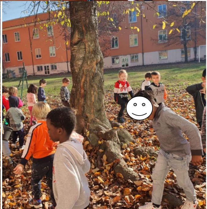
Canti e girotondi per la festa dell'albero