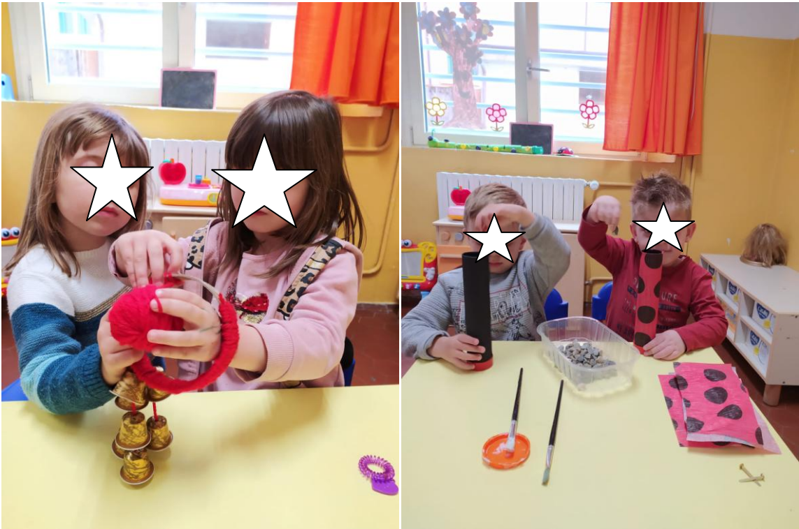
Costruzione degli strumenti "riciclosi"