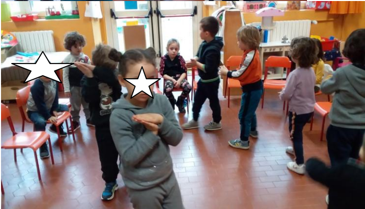
Ascolto di brani tratti dal “Carnevale degli animali” e giochi musicali